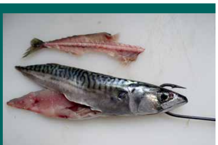
Makreel in de rubby dubby en een zogenoemde 'mackerel flapper' door beide kaken op de haak geprikt als aas.