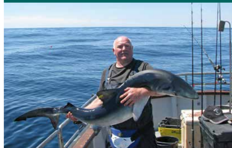
Meteen al de eerste dag kwamen er diverse schitterende blauwe haaien tot ruim twee meter aan boord.