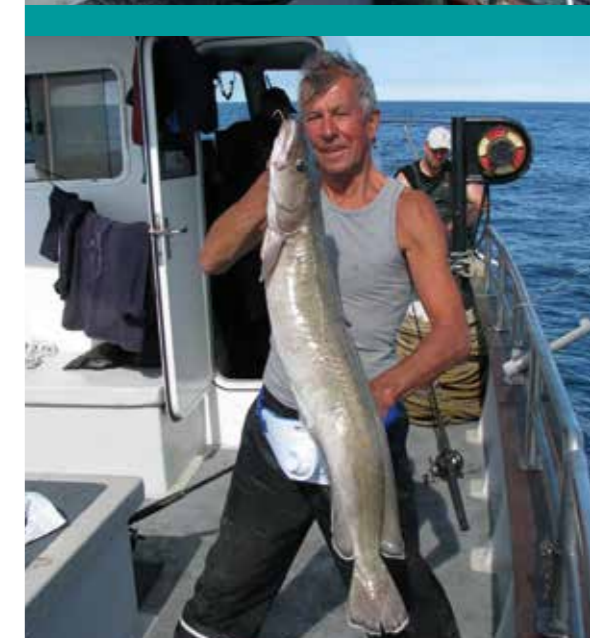
Tussen de bedrijven door kon er dicht onder de kust ook lekker licht op pollak worden gevestigd en (op een wrak) op mooie lengen.