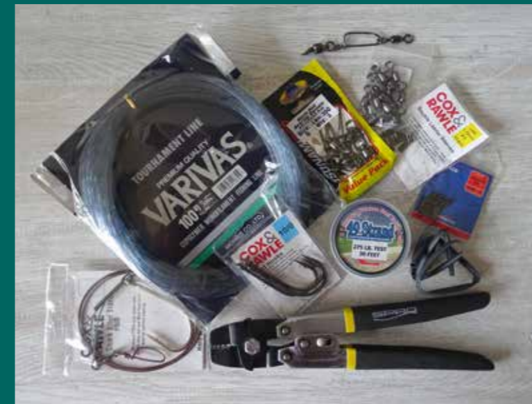
Alle benodigde onderdelen voor een uit twee delen bestaande haaienonderlijn.

Voor ons bestond de voorpret ook uit het zelf knopen van de benodigde onderlijnen, waarvoor we alle onderdelen 'gewoon' in Vlaanderen konden aanschaffen.